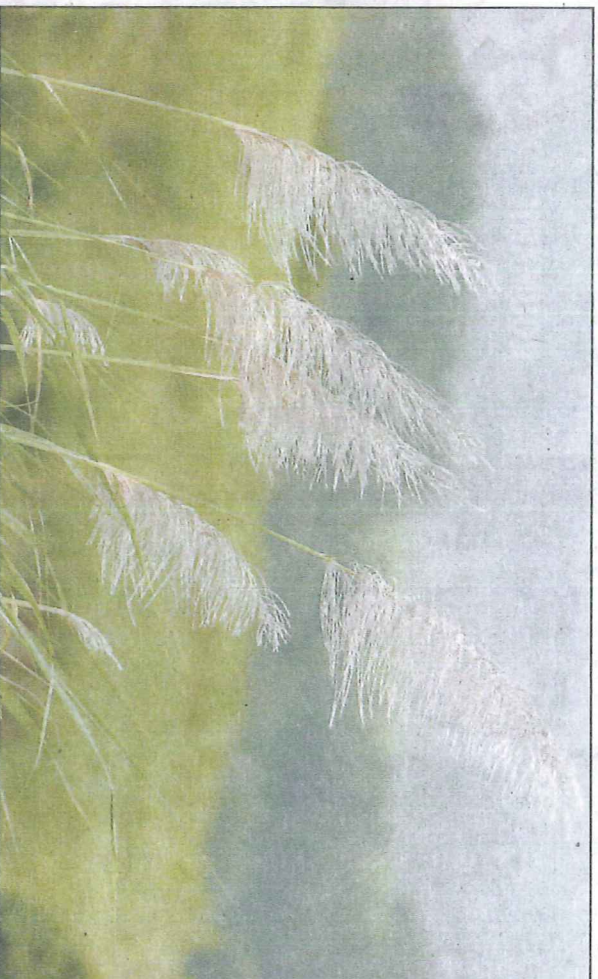
Les allergies aux pollens sont relativement peu fréquentes à la Réunion. Ce sont les acariens qui se taillent la part du lion.

Les principales maladies allergiques sont l'asthme, l'eczéma et les rhinites. Parmi les nombreux allergènes, on trouve des pollens, des acariens, des moisissures ou encore des poils d'animaux. La rhinite allergique est une inflammation des muqueuses nasales. Elle se traduit par des démangeaisons dans le nez ou le nez bouché, des maux de tête, des éternuements ou encore une pharyngite. Les sifflements dans la poitrine ou le sentiment d'oppression sont les symptômes de l'asthme et peuvent être le résultat d'allergies pas soignées ou mal traitées.