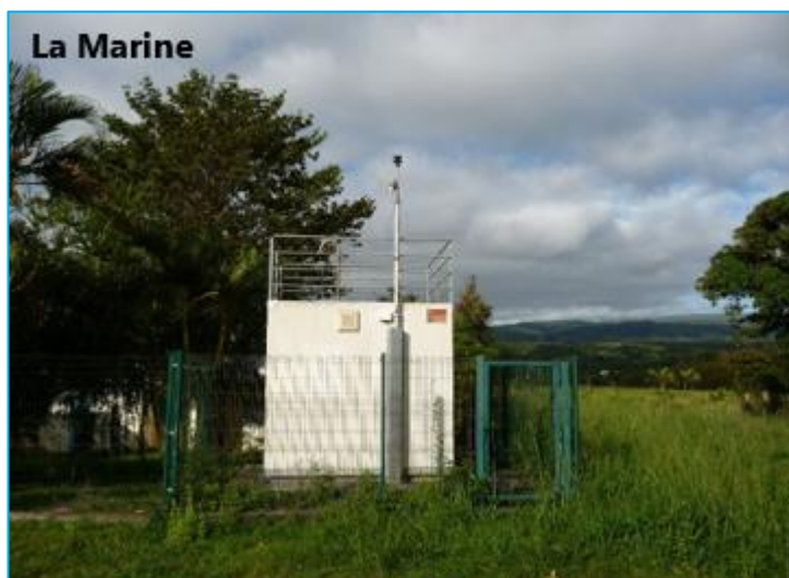
Figure 2 : Station fixe La Marine à proximité de la centrale thermique d'Albioma Bois Rouge.