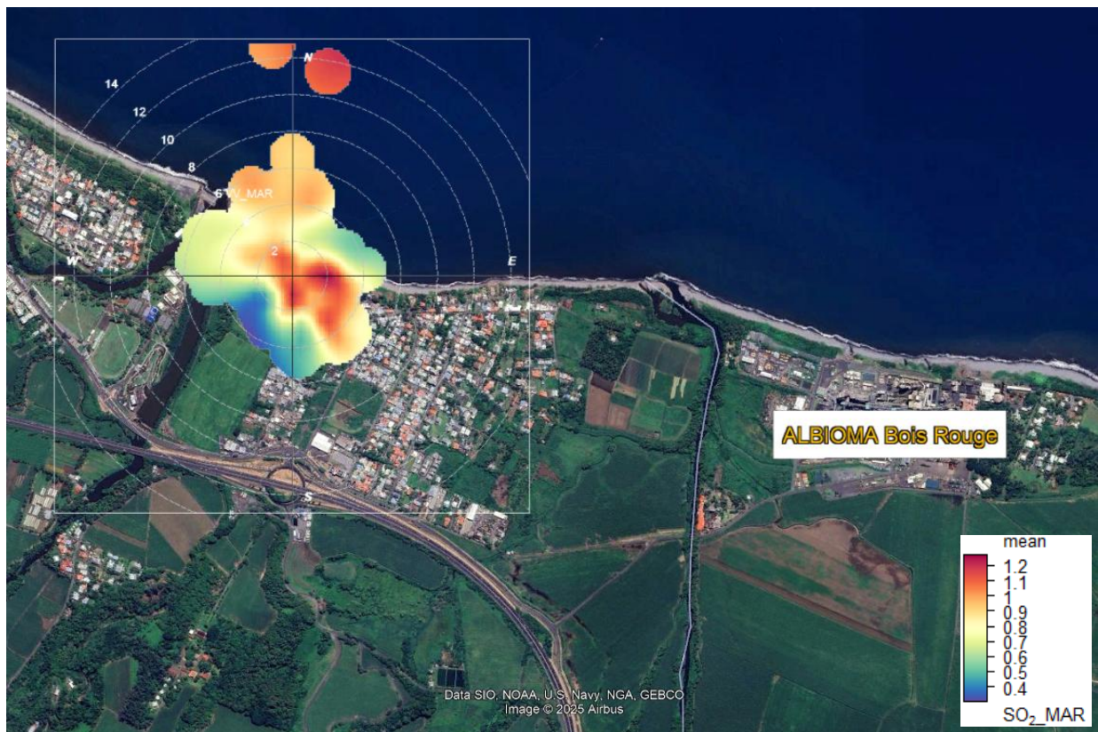
Figure 6 : Roses de pollution en SO 2 sur la station MAR au cours de l'année 2024.