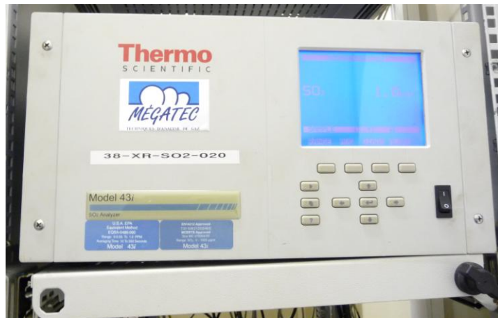
Figure 3 : Analyseur Thermo 43i implanté dans la station fixe MAR.