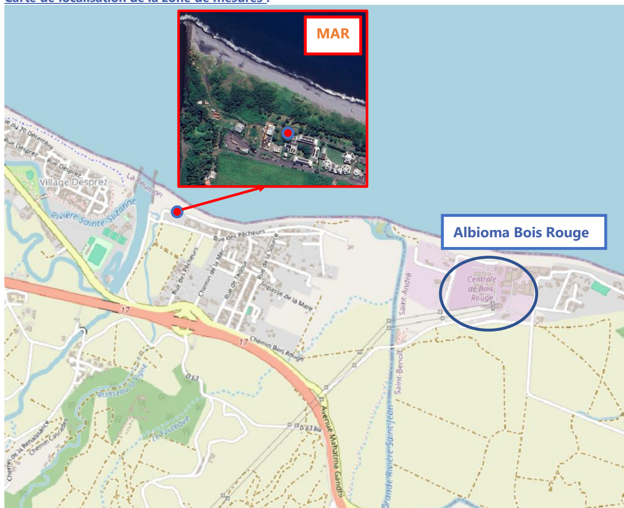
Figure 1 : Station de surveillance fixe La Marine localisée à proximité de la centrale thermique ALBIOMA Bois Rouge (ABR) (Sources : 2024 ©Google Earth, MapBox, OpenStreetMap).

Carte de localisation de la zone de mesures :