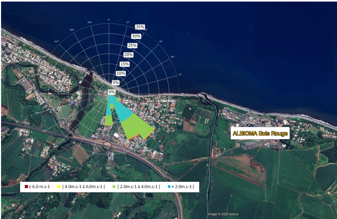
Figure 5 : Rose des vents sur le site de La Marine au cours de l'année 2024.

La Figure 6 présente les roses des concentrations moyennes horaires en \text{SO}_2 pour chaque secteur et de vitesse de vent considéré, sur la station MAR du 01/01/2024 au 31/12/2024 à partir des mesures de vitesse et de direction du vent mesurées sur la station MAR. Plus on s'éloigne du centre du graphe plus les vents sont forts (5-10-15-20 \text{m.s}^{-1} ).